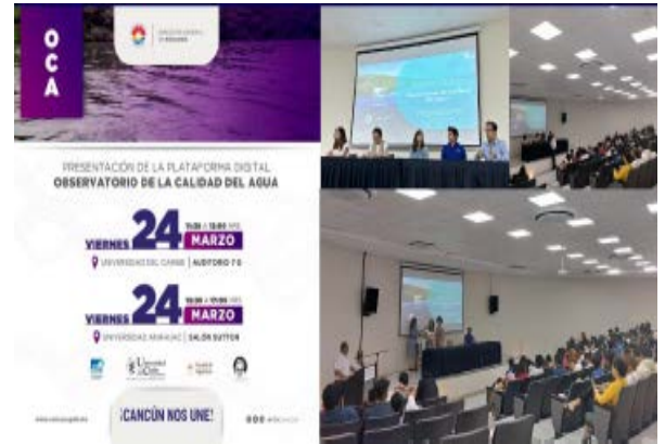
Presentación del Observatorio de la Calidad del Agua (Dirección de Ecología)