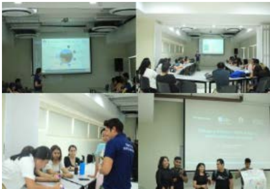
Mesas de Diálogo y Reflexión sobre el Agua y sus Ecosistemas Asociados