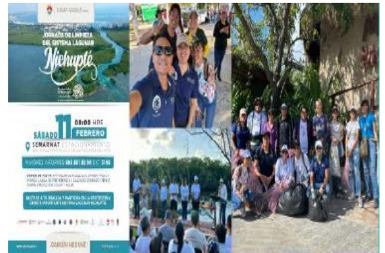
Brigada de Limpieza del Sistema Lagunar Nichupté (Dirección de Ecología).