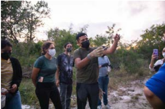
Proyecto de Investigación y Servicio Social: Educación Ambiental para la Conservación de Murciélagos Urbanos (CINVESTAV).